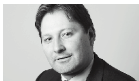
Pascal Gentinetta Finances et fiscalité Politique du marché postal