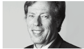
Paul Kurrus Transports