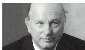
Bertrand Gros Rolex SA, Genève