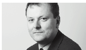
Urs Rellstab Communication