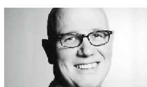
Heinz Hohl Tela-Kimberly Switzerland Sàrl, Niederbipp