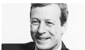
Ph. Olivier Burger PKZ Burger-Kehl & Co. SA, Zurich