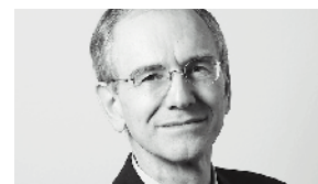
Gregor Kündig International (OMC, UE) Politique des transports