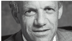
Johann N. Schneider-Ammann Vice-président Ammann Suisse SA Langenthal