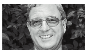
Max Theodor Herzig Carl Spaeter SA, Bâle