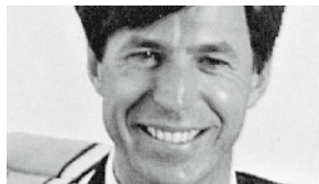
Oscar A. Kambly Kambly SA Spécialités de Biscuits Suisses, Trubschachen