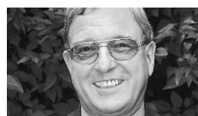
Max Theodor Herzig Carl Spaeter AG, Basel