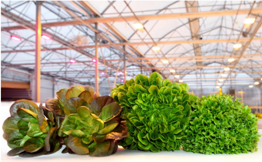
Le insalate nella serra pilota di CombaGroup a Molondin (VD)

Quali sono dunque i vantaggi di questa tecnologia? Nel confronto con la coltivazione tradizionale in terra, si risparmia il 90% di acqua, non si utilizzano pesticidi e il rendimento è da 10 a 15 volte superiore. E inoltre si possono coltivare le insalate tutto l'anno, con dei cicli di circa cinque/sei settimane. Il concetto ha già attratto un partner della regione che collabora e investe nella start-up. Diversi altri progetti di serre sono già previsti in Svizzera e all'estero.