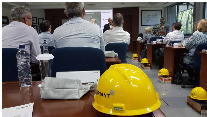
Visite d'entreprise à Tangerang.

Outre la formation professionnelle, les discussions ont porté principalement sur les négociations en vue de la conclusion d'un accord de libre-échange entre l'Indonésie et l'AELE, la conclusion aussi rapide que possible d'un nouvel accord sur la protection des investissements et une meilleure protection de la propriété intellectuelle. En deux mots, les deux parties aspirent à des solutions communes sur ces questions et à une intensification de la collaboration.